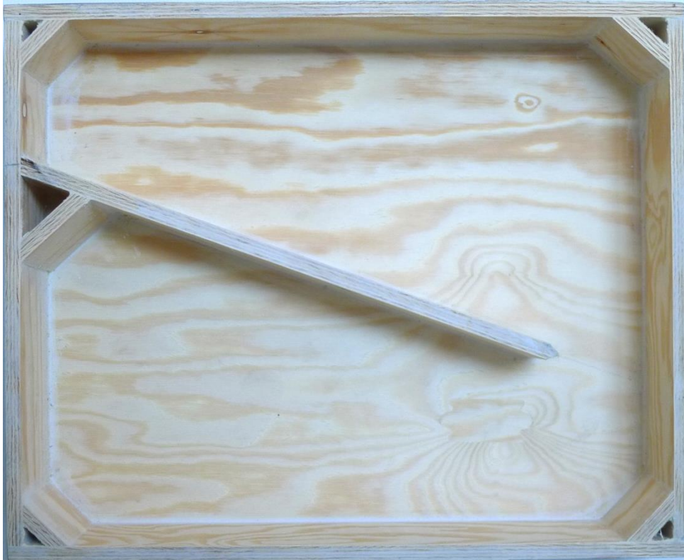
Innsiden på ferdige veggbokser fra Fence Audio, med transmisjonslinje prinsipp.

Solide veggbokser gir en markant forbedring av lyden i ethvert innebyggings system. Lyden fylles med kraft og det blir trykk og klem i bassen. Spredning til andre rom blir også vesentlig redusert. Boksene får du kjøpt ferdig hos FNKY.no, eller du kan, med litt tålmodighet, bygge dem selv.